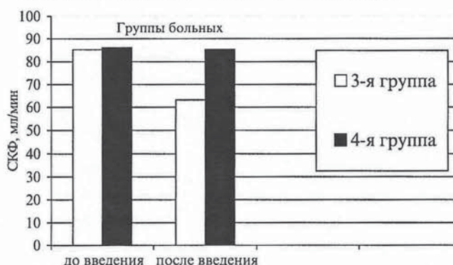
Рис. 2. Изменение СКФ у больных хроническим гломерулонефритом с ХПН до и после введения допамина.